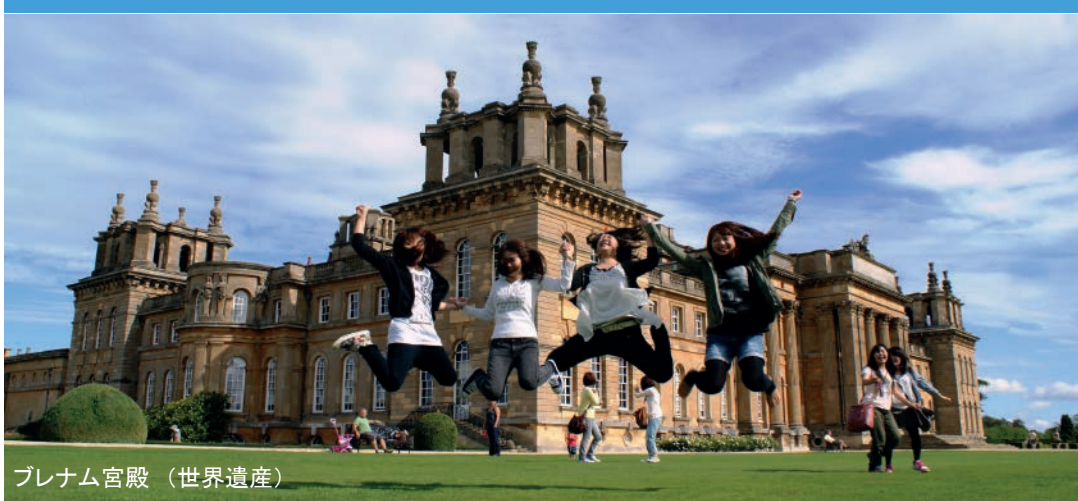
ブレナム宮殿 (世界遺産)